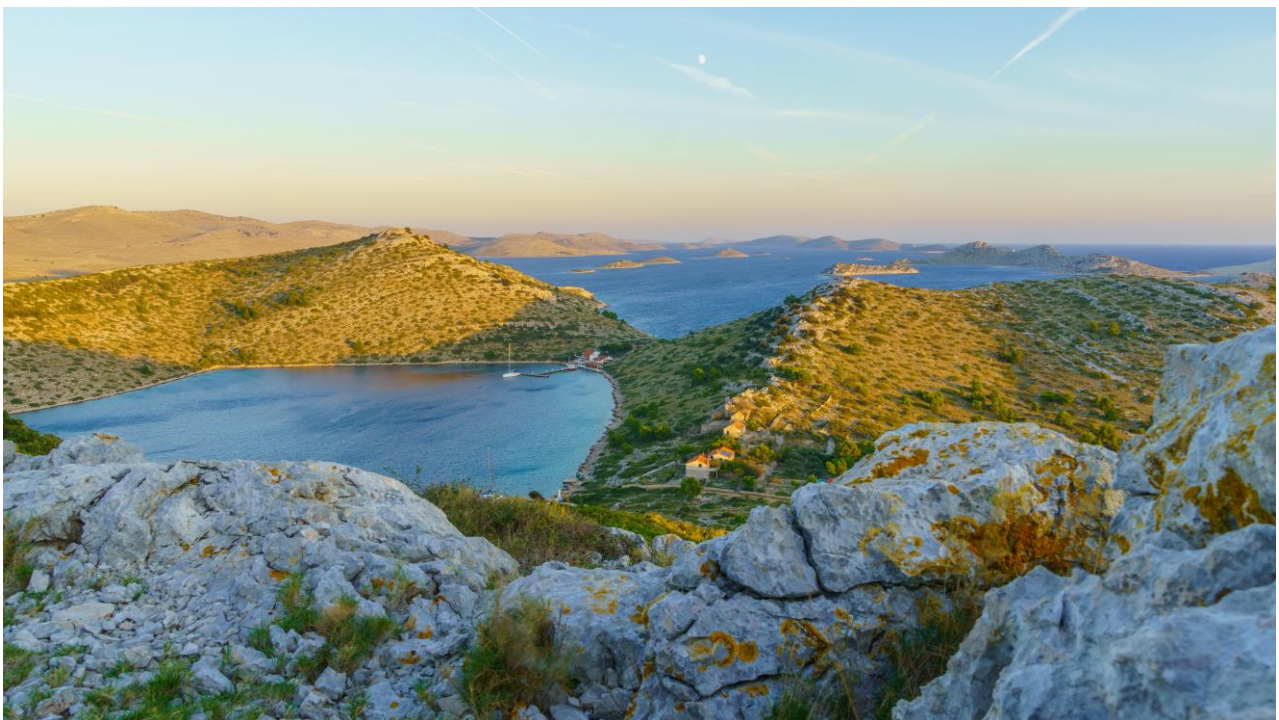
Bild: Nationalpark Kornati